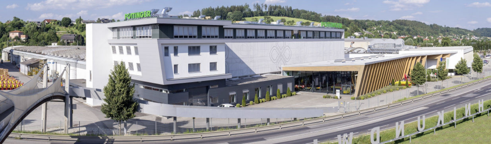
Pöttinger Stammwerk in Grieskirchen